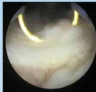
Rapida creazione dell'arco elettrico.