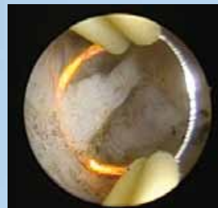
BIPOLAR CUT++ con dosaggio automatico della potenza per la resezione bipolare in NaCl.

ERBE Italia S.r.l. Viale Sarca, 336/f 20126 Milano Italia Telefono +39 02 6474681 Telefax +39 02 64746830 info@erbe-italia.com www.erbe-italia.com