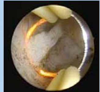
BIPOLAR CUT++ mit automatischer Leistungsdosierung für die bipolare Resektion in NaCl.

Rüsten Sie Ihr VIO 300 D auf mit dem bipolaren Resektionsadapter inkl. Software