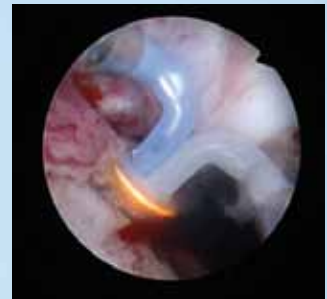
Homogene Effekte bei der Vaporisation von Gewebestrukturen.

ERBE Elektromedizin GmbH Waldhörnlestraße 17 72072 Tübingen Telefon 07071 755-0 Telefax 07071 755-179 sales@erbe-med.de www.erbe-med.de