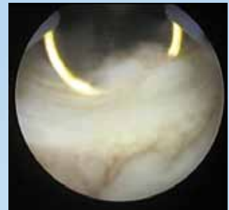
Schneller Aufbau des Lichtbogens.